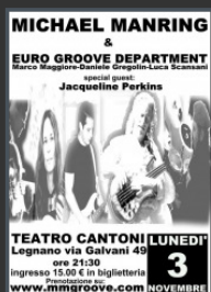
La locandina del concerto del 3 novembre 2008