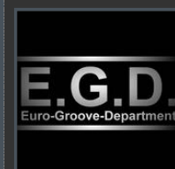
Il logo della band