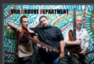
Gli EGD in una recente foto ufficiale